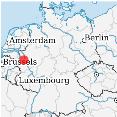
Lage in Deutschland