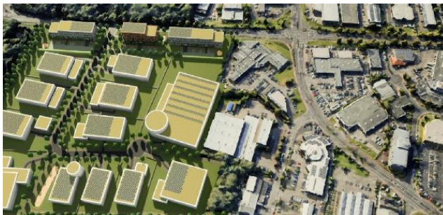
Gewerbequartier an der A 57 - Alte Heerstraße Dormagen