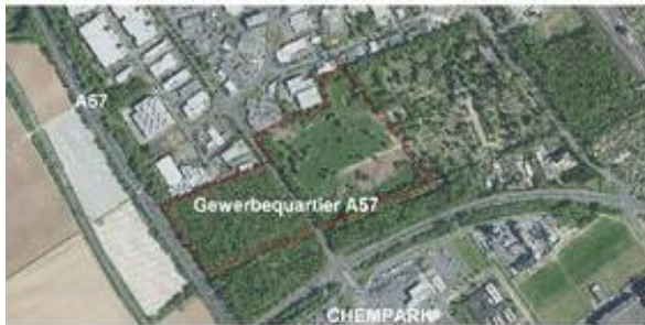
Büro- und Gewerbequartier A57.jpg