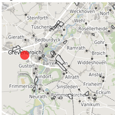
Lage in der Kommune