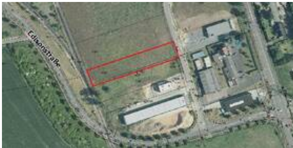
Verfügbare Flächen Borsigstraße.jpg