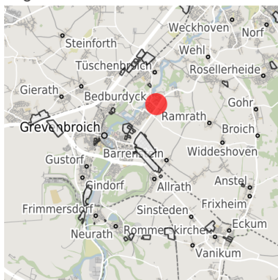
Lage in der Kommune