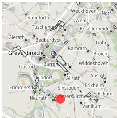
Lage in der Kommune