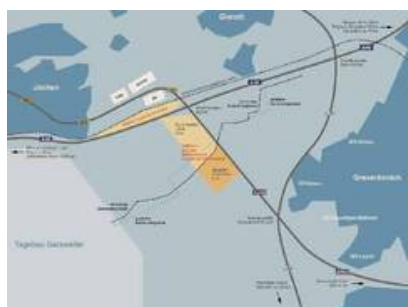
Interkommunales Gewerbegebiet Juechen-Grevenbroich