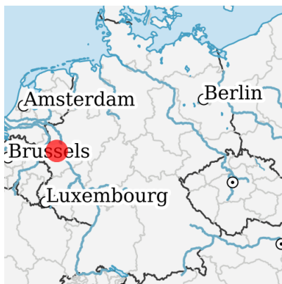
Lage in Deutschland